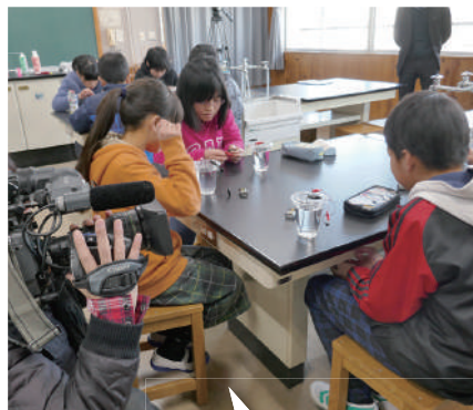
講師派遣授業にはメディアの取材が入ることも。

プラスエムは『学校と企業・団体双方の思いやニーズを熟知したコーディネーター』として認知されており、全国の教育関係者の広いネットワークを活かして、たくさんの講師派遣授業をサポートしています。